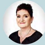
Καθηγήτρια Linda Johnston, Ιρλανδία/Καναδάς

„Τα νέα πρότυπα θα είναι ένας σημαντικός οδηγός για τους υπεύθυνους χάραξης πολιτικής, τις ρυθμιστικές αρχές και τους εκπαιδευτικούς φορείς. Ο στόχος είναι ότι τα βρέφη και οι οικογένειές τους στην Ευρώπη, θα λαμβάνουν, με συνέπεια και με βιώσιμο τρόπο, τεκμηριωμένη φροντίδα, που θα παρέχεται από μια διεπιστημονική ομάδα με υψηλής ποιότητας εξειδικευμένη εκπαίδευση και κατάρτιση. Με την παροχή υγειονομικής περιθαλψης σε όλη την Ευρώπη με βάση αυτές τις αρχές, μπορούμε να είμαστε σίγουροι ότι τα βρέφη και οι οικογένειές τους θα έχουν βελτιωμένα αποτελέσματα για μια ευτυχισμένη και υγιή ζωή.“