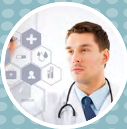
Συλλογή δεδομένων & τεκμηρίωση