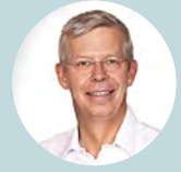
Καθηγητής Berthold Koletzko, Γερμανία

„Η διατροφή έχει τεράστιο αντίκτυπο στα μακροπρόθεσμα αποτελέσματα των πρώων βρεφών, ειδικά σε αυτά που γεννηθήκαν με πολύ χαμηλό βάρος γέννησης. Επηρεάζει την ανάπτυξή τους και την ανάπτυξη των οργάνων τους, συμπεριλαμβανομένης της ανάπτυξης του εγκεφάλου τους. Είναι σημαντικό να δημιουργηθεί συνοχή σε ολόκληρη την Ευρώπη όσον αφορά στα πρότυπα της διατροφικής φροντίδας των πρώων και να ενταχθούν σε αυτή τη διαδικασία οι διάφοροι ενδιαφερόμενοι, από τους επαγγελματίες υγείας ως τους γονείς.”