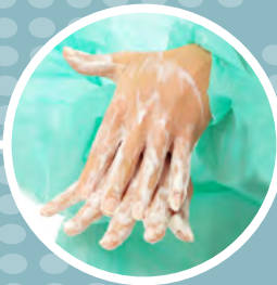
Ασφάλεια ασθενούς & πρακτικές υγιεινής