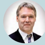
Καθηγητής Luc Zimmermann, Ολλανδία

„Μπορούμε να παρατηρήσουμε μεγάλη πρόοδο μέσα στον τομέα της ιατρικής περιθάλψης και κλινικής πρακτικής τις τελευταίες δεκαετίες, από την καλύτερη φαρμακευτική αγωγή μέχρι την ενσωμάτωση των γονέων στις κλινικές διαδικασίες. Η δικτύωση μεταξύ των επαγγελματιών έχει βελτιώσει τη νεογνική φροντίδα και θα συνεχίσει να το κάνει εάν συνεργαστούμε σε ευρωπαϊκό επίπεδο. Η καθιέρωση κατευθυντήριων οδηγιών θα μας επιτρέψει να κάνουμε διαρθρωτικές αλλαγές σε όλη την Ευρώπη και θα έχει αντίκτυπο στην κοινωνία.”