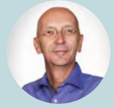
Καθηγητής Jos Latour, Ηνωμένο Βασίλειο

„Το εύρος της εντατικής νοσηλείας νεογνών διευρύνεται και έγιναν μεγάλες προσπάθειες στις μονάδες εντατικής νοσηλείας νεογνών για τη μείωση της νεογνικής θνησιμότητας. Αλλά σε αυτή τη διαδικασία είναι σημαντικό να προστατεύεται η αξιοπρέπεια και η συνοχή των βρεφών και των οικογενειών τους με την κατάλληλη προσοχή ώστε να ελαχιστοποιηθεί η περιττή ταλαιπωρία. Τα ιατρικά δεδομένα πρέπει να διευκρινίζονται όσο το δυνατόν καλύτερα, αλλά εξίσου σημαντικό είναι το ότι η οικογένεια πρέπει να συμμετέχει. Οι συνθήκες ζωής και οι απόψεις των γονέων, καθώς και η επιθυμία τους να συνεισφέρουν σε οποιαδήποτε απόφαση, μπορεί να γίνουν γνωστές μόνο με τη συμμετοχή τους.“