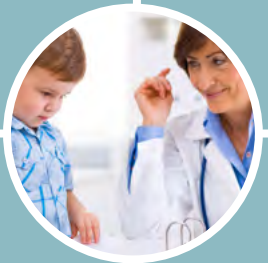
Μακροχρόνια παρακολούθηση και συνεχής φροντίδα