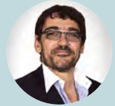
Καθηγητής Pierre Kuhn, Γαλλία