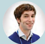
Δρ James Webbe, Γαλλία

„Η συλλογή δεδομένων και η τεκμηρίωση συχνά αποτυγχάνουν να ανταποκριθούν στις άμεσες προσδοκίες των γονέων και στις μετέπειτα ανάγκες των πρώην νεογνολογικών ασθενών. Ωστόσο, οι πρόσφατες τεχνολογικές εξελίξεις προσφέρουν τεράστιες ευκαιρίες για αποτελεσματική χρήση των δεδομένων: η βέλτιστη χρήση των δεδομένων μπορεί να βελτιώσει την παροχή φροντίδας και τα επακόλουθα αποτελέσματα των ασθενών. Γενικά, υπάρχουν δύο μεγάλες προκλήσεις στη συλλογή και τεκμηρίωση δεδομένων στην Ευρώπη: η προσβασιμότητα των δεδομένων και η συγκρισιμότητα των δεδομένων. Πρώτον, δεν είναι τακτικά διαθέσιμα όλα τα σχετικά δεδομένα. Δεύτερον, η ανομοιογένεια των συστημάτων υγειονομικής περίθαλψης είναι η πλήρη όλων των διεθνών συγκρίσεων για την ποιότητα της υγειονομικής περίθαλψης. Δίνουμε συστάσεις για την αποφυγή παγίδων στην ερμηνεία αυτού του είδους των δεδομένων και για την ενθάρρυνση της χρήσης ήδη υπαρχουσών συγκριτικών βάσεων δεδομένων με καλή μεθοδολογική βάση.”