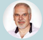
Καθηγητής Dieter Wolke, Ηνωμένο Βασίλειο/Γερμανία