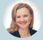
Δρ Britta Hüning, Γερμανία

„Η μελλοντική μακροχρόνια παρακολούθηση θα πρέπει να επικεντρωθεί περισσότερο στους πολλαπλούς παράγοντες που παίζουν ρόλο στην ακαδημαϊκή επιτυχία των πρόωρων βρεφών. Αυτό περιλαμβάνει την υγεία, τη συμμετοχή σε αθλήματα, την εκτελεστική λειτουργία, τον γονικό υποστηρικτικό ιστό και την κοινωνική νύση, την κατανόηση συναισθημάτων και τις κοινωνικές δεξιότητες και την καλύτερη σύνδεση με τις εκπαιδευτικές υπηρεσίες. Γνωρίζουμε επίσης ότι η κοινωνικοποίηση με τα αδέρφια ή τους συνομήλικους από το νηπιαγωγείο μέχρι το σχολείο είναι ζωτικής σημασίας για τη παροχή μακροχρόνιας υποστήριξης και ευτυχίας σε παιδιά υψηλού κινδύνου. Ο συντονισμός και η διαχείριση των ραντεβού από έναν κοινωνικό λειτουργό, που βοηθά τους στρεσαρισμένους γονείς, είναι σημαντικό στοιχείο. Η φροντίδα και η έρευνα πρέπει να συμβαδίζουν. Δεν είναι πάντοτε εμφανές ποιες παρεμβάσεις μπορεί να είναι ωφέλιμες για το βρέφος και τις οικογένειες και σε ποια ηλικία πρέπει να αρχίσουν. Η σύγκριση προγραμμάτων και η δημιουργία μιας διασυνοριακής έρευνας σχετικά με τις παρεμβάσεις είναι ένας καλός τρόπος για να προχωρήσουμε.”