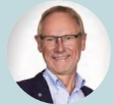
Δρ Björn Westrup, Σουηδία

„Η αναπτυξιακή φροντίδα με επίκεντρο το βρέφος και την οικογένεια στοχεύει να βελτιώσει την μακροχρόνια υγεία των βρεφών και των γονέων, αναγνωρίζοντας την σημασία της συμμετοχής των γονέων και της εξατομικευμένης φροντίδας που βασίζεται στη συμπεριφορά του βρέφους. Η παροχή οικογενειακής πρόσβασης στη MENN 24/7 και η υποστήριξη για τη συμμετοχή των γονέων στη φροντίδα του βρέφους τους από την αρχή της νοσηλείας είναι θεμελιώδεις και υποστηρίζονται από επιστημονικά δεδομένα. Παρατηρούμε ότι σε ορισμένες χώρες, οι γονείς εξακολουθούν να αντιμετωπίζονται ως επισκέπτες. Ωστόσο, η πρόσβαση της οικογένειας και η συμμετοχή των γονέων στη φροντίδα των βρεφών τους είναι επίσης ζήτημα ηθικής και ανθρωπίνων δικαιωμάτων. Η προσαρμογή του κλινικού πλαισίου στις ανάγκες του βρέφους και της οικογένειας απαιτεί μια αλλαγή στη νοοτροπία των νοσοκομειακών διοικήσεων, αλλά η αναπτυξιακή φροντίδα με επίκεντρο το βρέφος και την οικογένεια θα αποδειχθεί τελικά επιτυχής όχι μόνο στην Ευρώπη αλλά εκτός αυτής και θα υποστηριχθεί από περαιτέρω επιστημονικά δεδομένα.”