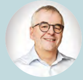
Δρ Dietmar Schlembach, Γερμανία

„Αν είχαμε μία επιθυμία, αυτή θα ήταν να εξασφαλίζαμε ότι στο κοντινό μέλλον όλες οι έγκυοι γυναίκες στην Ευρώπη – ανεξαρτήτως της περιοχής στην οποία ζουν – θα λάβουν μία βέλτιστη ιατρική θεραπεία κατά τη διάρκεια της εγκυμοσύνης και του τοκετού. Γυναίκες με επιπλοκές στην εγκυμοσύνη τους – παρότι ο αριθμός τους μπορεί να είναι μικρός – θα πρέπει να κατευθύνονται σε ειδικούς ή/και εξειδικευμένα κέντρα εγκαίρως ώστε να επιτραπεί η βέλτιστη προ-, περι- και μεταγεννητική φροντίδα. Οι γονείς θα πρέπει επίσης να συμμετέχουν ενεργά στην περιγεννητική φροντίδα.”