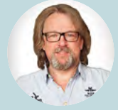
Δρ Atle Moen, Νορβηγία

„Ο κλάδος του Σχεδιασμού MENN είναι ταχέως εξελισσόμενος και πολύ σημαντικός. Αρχικά, οι MENN δεν κατασκευάζονταν ώστε να έχουν τους γονείς παρόντες 24/7 και βρισκόμαστε ακόμη αντιμέτωποι με τεράστιες διαφορές σχετικά με την ποιότητα και τις εγκαταστάσεις των MENN σε όλη την Ευρώπη. Συνεπώς, η ουσία του θέματος είναι να ανακατασκευάσουμε και να αναθεωρήσουμε και να χρησιμοποιήσουμε την αρχιτεκτονική ως κάποιο είδος φαρμάκου. Το θέμα δεν είναι ο ωραίος σχεδιασμός αλλά η δημιουργία εγκαταστάσεων για να βρεθούν κοντά οι γονείς με τα παιδιά τους, έτσι ώστε η MENN να γίνει ένα ωραίο μέρος για την ευεξία και θεραπεία των ασθενών.“