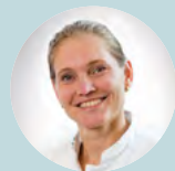
Δρ Marije Hogeveen, Ολλανδία

„Για μεγάλο διάστημα η υγιεινή στη θεραπεία και τη φροντίδα είχε παραμεληθεί. Τα μέτρα για το θέμα αυτό έκαναν σημαντικές και τεράστιες βελτιώσεις μειώνοντας τις λοιμώξεις των νεογνών και των προώρων, με αποτέλεσμα καλύτερα μακροπρόθεσμα αποτελέσματα. Τα περισσότερα ανεπιθύμητα συμβάντα ή σφάλματα δεν μπορούν να επιλυθούν σε ατομικό επίπεδο, αλλά μάλλον σε επίπεδο συστήματος. Στις ιατρικές ομάδες πρώτης γραμμής πρέπει να παρέχεται ένα σύστημα που έχει σχεδιαστεί έτσι ώστε να τις διευκολύνει να πράττουν το σωστό. Είναι ευθύνη των ηγετών της υγειονομικής περιθαλψης και των φορέων χάραξης πολιτικής να διασφαλίσουν την εφαρμογή ενός τέτοιου εξαιρετικά αξιόπιστου συστήματος.“